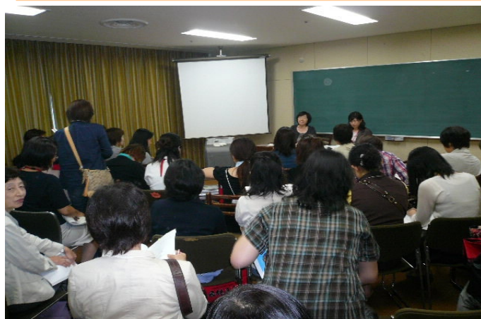
ビデオセッションでの質疑応答の様子